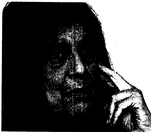
Susan Sontag under bokmessen i Frankfurt i 2003. Hun døde av kreft i New York 28. desember 2004, 71 år gammel.