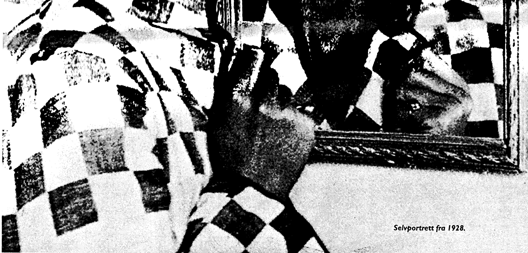
Selvportrett fra 1928.