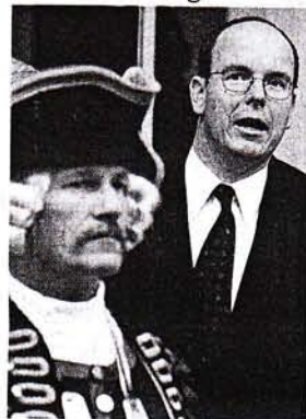
Prinz Albert mit einem Langen Kerl in der Landeshauptstadt Potsdam

So waren auf der Bühne die In- strumentalisten auf einer Breite von gut 60 Metern verteilt. Hinzu kamen vier Bläsergruppen, die von ver- schiedenen Standpunkten im Dom aus spielten. Vor dem Altar mussten dutzende Stuhlreihen überbaut werden, damit Riesenorchester und