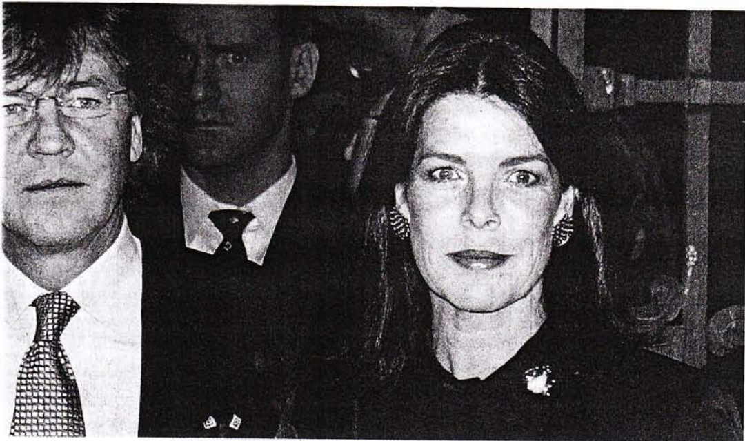
zusammen zur Aufführung von Hector Berlioz' Requem in den Berliner Dom: Prinzessin Caroline und ihr Ehemann Ernst August von Hannover.